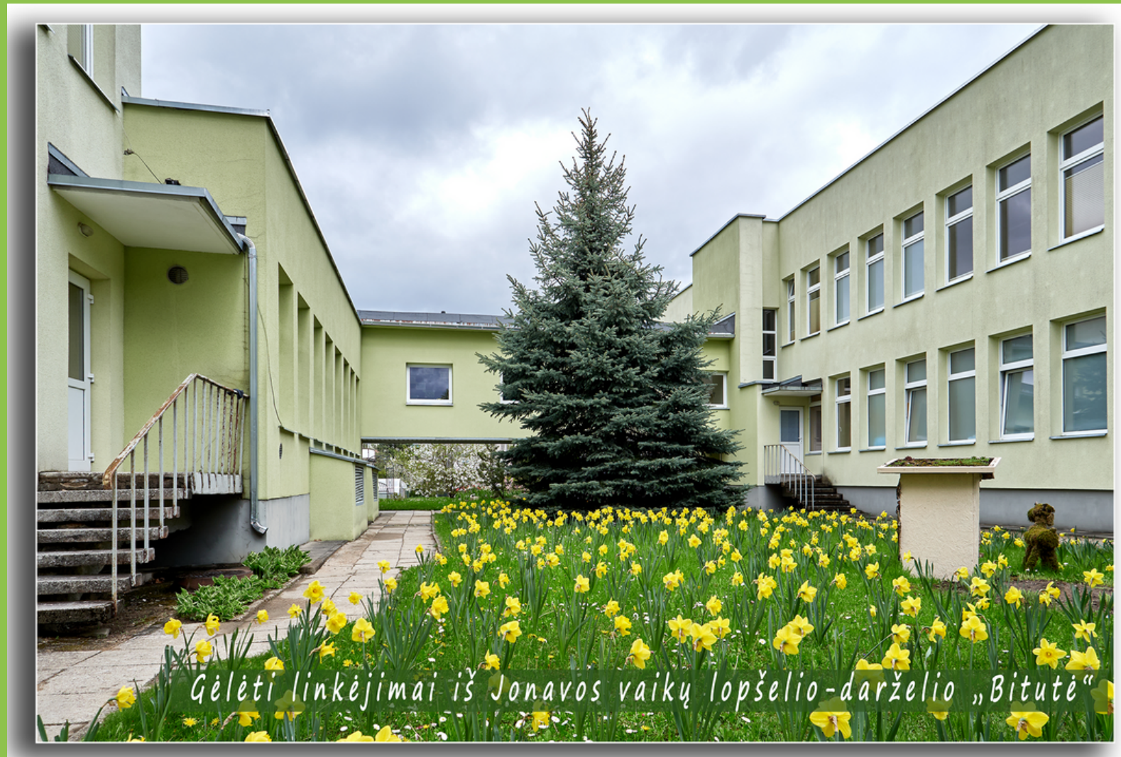
Gėlėti linkėjimai iš Jonavos vaikų lopšelio-darželio „Bitutė“

SKIRKITE 1,2 % PARAMĄ JONAVOS VAIKŲ LOPŠELIUI-DARŽELIUI "BITUTĖ"